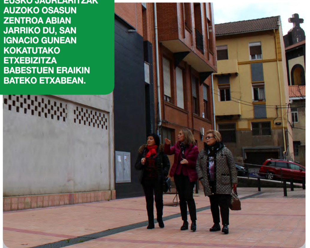
La alcaldesa de Barakaldo junto a dos vecinas de Retuerto en el local que ocupará el nuevo centro de salud.

EUSKO JAURLARITZAK AUZOKO OSASUN ZENTROA ABIAN JARRIKO DU, SAN IGNACIO GUNEAN KOKATUTAKO ETXE BIZITZA BABESTUEN ERAIKIN BATEKO ETXABEAN.